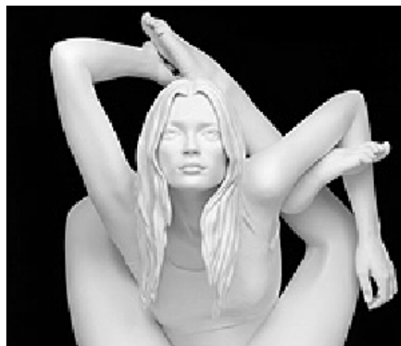
La modella Kate Moss in una statua di Marc Quinn, in mostra a Roma al «Macro» e nella galleria Bonomo

È già fissato l'appuntamento all'anno prossimo: quando saranno presentate le sue installazioni, realizzate col sale di Margherita.